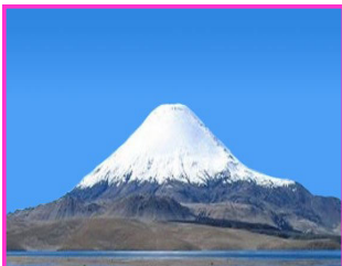
Ojos del Salado